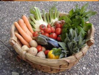
Evolution des AMAP en région PACA